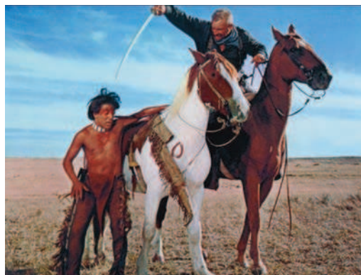
Dustin Hoffman «pequeño gran hombre» corriendo serio peligro

Las brutales matanzas cometidas bajo el mando de Custer pronto harán cambiar de opinión a «Pequeño Gran Hombre».