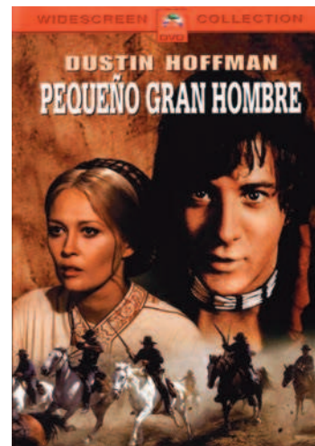
Pequeño gran hombre (Arthur Penn, 1970)

Esta película es la crónica de la traición de la nación norteamericana a sus pobladores primigenios. Tras desalojarlos paulatinamente de sus territorios, se prometió a los indios una tierra que sería suya «mientras la hierba crezca, el viento sople y el cielo sea azul». Confiados por esta promesa, fueron víctimas de sucesivas masacres. Su victoria sobre Custer fue el último acto de resistencia eficaz, al que siguieron sólo derrotas frente a las armas avanzadas. Como veremos, según esta película, esa derrota fue fruto de la enajenación megalómana de Custer, quien cercano a su fin grita: «¡Soy invencible! ¡soy invencible!».