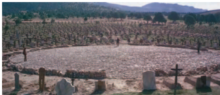
Clint Eastwood, Eli Walach y Lee Van Cleef a punto para el «truelo» de El bueno, el feo y el malo

La expresión «El bueno, el feo y el malo» se repite hasta 175 veces como metáfora en publicaciones científicas, según citan Bezuglyi y Handelman, quienes también la usan en el título de su reciente trabajo sobre Medidas en Conjuntos de Cantor 5 . Los investigadores españoles Armengual y Toral efectuaron el análisis matemático de los truelos en un trabajo que está accesible en la red 6 . Se citan como ejemplos de