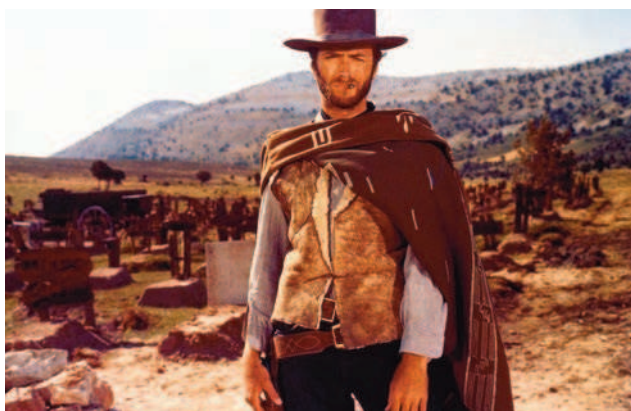
Clint Eastwood, omnipresente en los «spaghetti» western

Desglosando los sucesos y calculando sus probabilidades, se concluye que la probabilidad de que se salve uno cualquiera de los tres es de 1/4 ; que la probabilidad de que perezcan los tres es también de 1/4 ; y que, con esas premisas, es imposible que se salven dos. Es un buen ejercicio de aula.