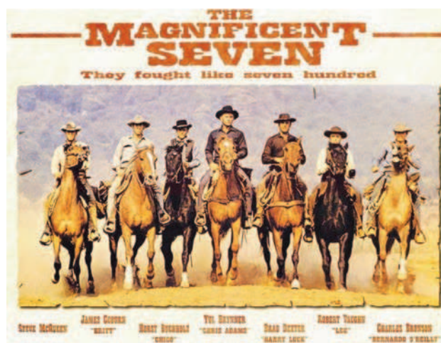
Los siete magníficos (John Sturges, 1960)

menospreciada por Hollywood dando a estas películas esa denominación jocosa que era, en su intención, sinónimo de western de baja calidad. Sin embargo, las películas de Leone han ganado valoración con el paso del tiempo. Les caracterizan: la crueldad de los personajes; los diálogos escuetos y sentenciosos; y la genial música compuesta por Ennio Morricone, que entonces comenzaba su fecunda y exitosa carrera. Otras coproducciones latinas quisieron seguir esa senda, pero quedaron lejos de aquel nivel.