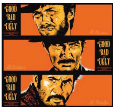
El bueno, el feo y el malo (Sergio Leone, 1966)

El número seis es importante en el Oeste. También se insiste sobre ello en El Bueno, el Feo y el Malo (Sergio Leone. 1966). El Bueno (Clint Eastwood) descubre que le sigue un grupo de pistoleros y, mientras los cuenta, conversa con el jefe de la banda: