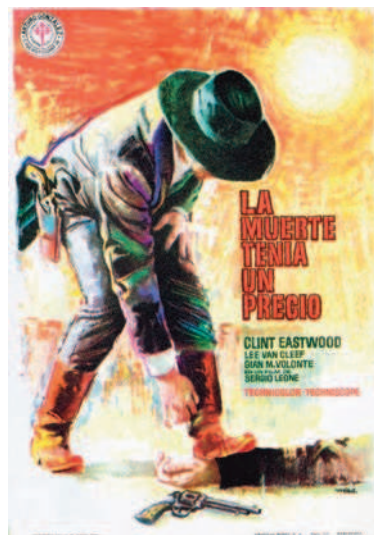
La muerte tenía un precio (Sergio Leone, 1965)

souri) y Sacramento (California). El proyecto chocaba con los intereses secesionistas californianos y por ello se intenta hacer fracasar el viaje inaugural. Buffalo Bill (Charlton Heston) y sus amigos intentarán evitarlo logrando que el Pony Express realice su trayecto con éxito.