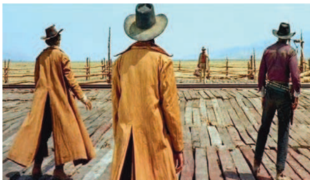
Fotograma de Hasta que llegó su hora (Sergio Leone, 1968)

Se le ve arrojar arena por encima y después meterse en el río.